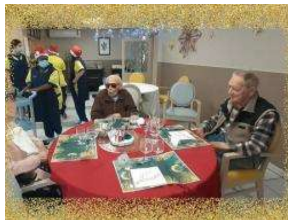
Déjeuner de Noël le 25 Décembre.

Up et et Pasa aussi, parés de leurs décorations de Noël! Prêts pour réveillonner!